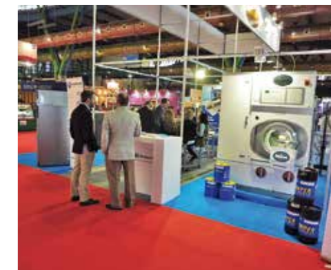
H&T garantiza un catálogo integral de productos y servicios y un programa de conferencias, charlas y mesas redondas dirigido al reciclaje y la actualización de conocimientos.