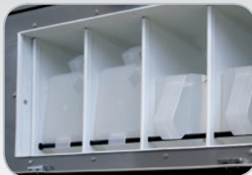
Dosificación interna LS-355

Los productos químicos siempre son diluidos previamente en el colector evitando dañar el tejido por el contacto directo.