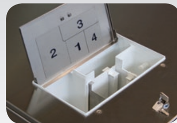
Dosificación interna LS-332

ALTERNATIVAS DE CALEFACCIÓN: Eléctrica, Vapor, Sin calefacción (aportación externa de agua caliente)